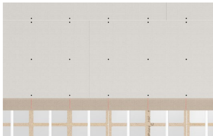
Figur 3 Mellemlagsplader af gulvgips eller fibergips på 22, 25 og 38 mm Klimagulve monteres med skruer efter de samme principper som vist på figur 2. Udførelse og skruedimensioner fremgår af Faktabladene #2 og #18.

Mellemlagsplader af 12 mm spånplade fastgøres til Klimagulve med spånpladeskruer 3,5 × 35 mm. Pladerne limes i fer- og not med 1-komponent D3 PVAc-lim. Der lægges en gulvpap (500 g/m 2 ) mellem varmfordelingspladerne og mellemlagspladerne for at undgå knirkelyde.